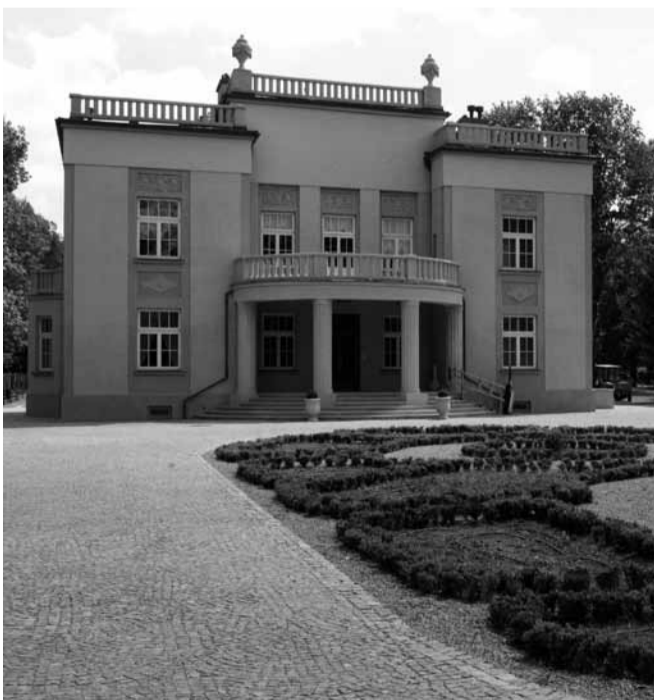
Dom dyrektora Zakładów Azotowych w Mościcach przy ulicy Jarzębinowej

24 stycznia 2002 – uchwała Sejmu Rzeczypospolitej Polskiej w sprawie ustanowienia roku 2002 Rokiem Eugeniusza Kwiatkowskiego