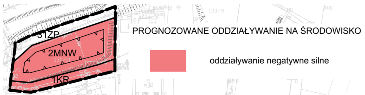
Rysunek 4 Oddziaływanie projektu zmiany planu na środowisko – schemat nr 3