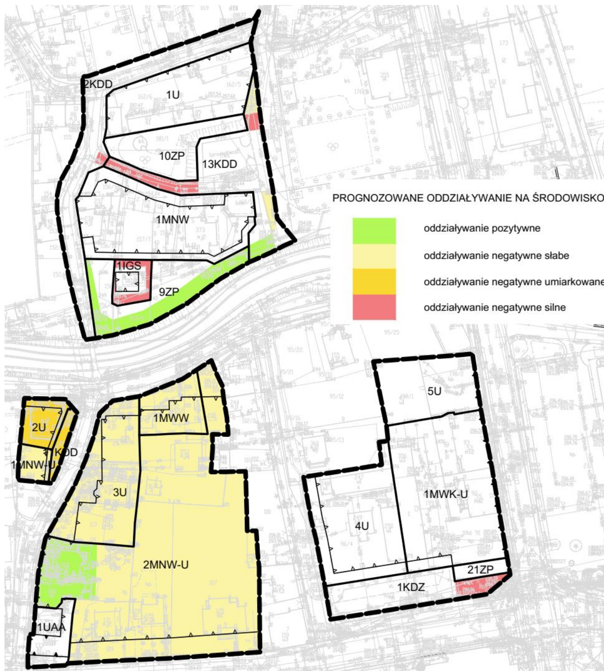
Rysunek 2 Oddziaływanie projektu zmiany planu na środowisko – schemat nr 1