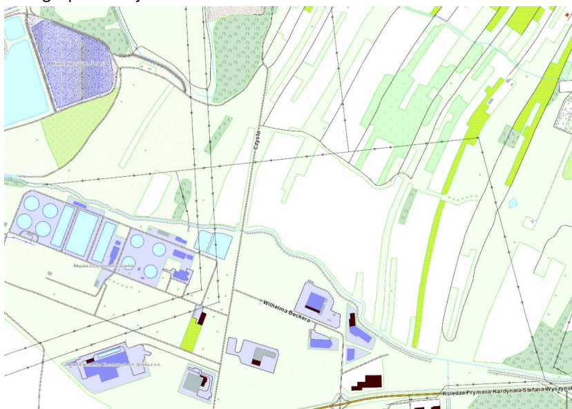
Rys. 1 - Obszar opracowania

Obszar znajduje się w północno-zachodniej części miasta Tarnowa. I ograniczony jest od południa rowem Chyszowskim a od północy ciekim powierzchniowym „bez nazwy”. W stanie istniejącym obszar jest niezurbanizowany, z dominującym zagospodarowaniem rolnym i łąkami. W bezpośrednim sąsiedztwie terenu objętego opracowywaną zmianą miejscowego planu zagospodarowania przestrzennego znajdują się osadniki Zakładów Azotowych, oczyszczalnia ścieków i klaster aktywności gospodarczej.