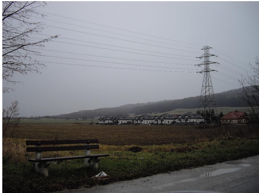
Rysunek 3 Pole uprawne i linia elektroenergetyczna wysokiego napięcia widziane z al. Tarnowskich, w tle zabudowa mieszkaniowa jednorodzinna znajdująca się poza obszarem opracowania (przy ul. św. Marcina) oraz Góra św. Marcina