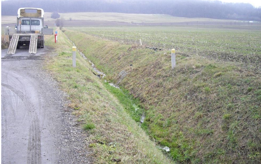
Rysunek 2 Pole uprawne i rów odwadniający wzdłuż ul Modelarskiej, w tle widok na Górę św. Marcina

i oddzielony arterią komunikacyjną - drogą krajową nr 94, co znacznie ogranicza szansę migracji większych ssaków.