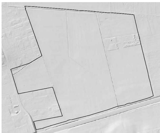
Rysunek 1 Rzeźba terenu na obszarze opracowania